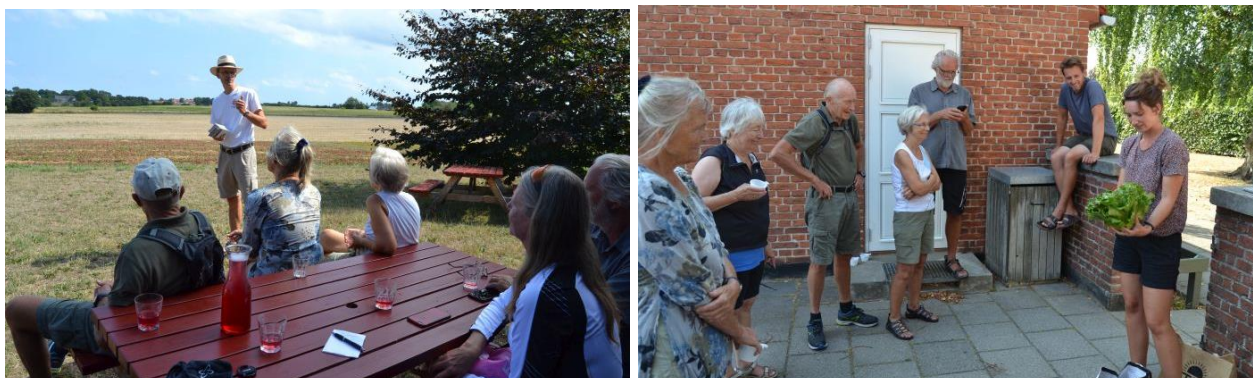
Billeder fra klimacykeltur 2018 til Rokkedyssebær på Gundekildegård og Tisvilde Fødevarerfællesskab.

Kortbrochuren blev fordelt på rådhusene for de 3 involverede kommuner Gribskov, Halsnæs og Hillerød samt på bibliotekerne, museerne m.v. Siden da har bibliotekerne løbende bedt om at få flere foldere og snart var der udsolgt. Nu har kommunerne og Dansk Vandrelaug finansieret et genoptryk med enkelte rettelser og godt nye 3000 foldere er nu fordelt i området. Desuden kan man downloade folderen som pdf-fil via: http://www.friefugle.dk/Arresoefolder.pdf eller få den tilsendt mod betaling af porto herfra – gå til bestilling på www.friefugle.dk Talerne, som blev holdt ved indvielsen kan ses og høres her via den lokale TV-station, Radio Kattegat http://www.tvkattegat.dk/?p=1849 Vi håber mange i løbet af sommeren vil få glæde af friluftskortet – både til vands og til lands. Husk, at Foreningen Frie Fugle har 2 kajaker liggende ved Huseby, som du kan benytte som medlem.