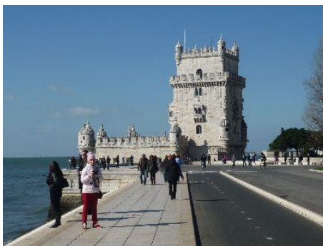
Belém tårnet i Lissabon