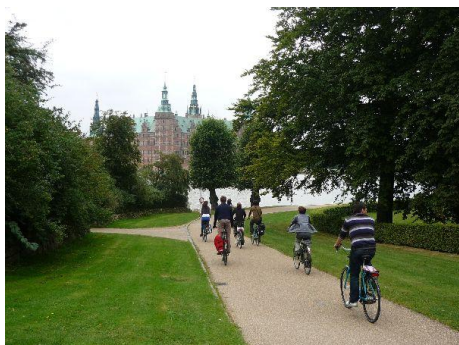
Frederiksborg Slot i Hillerød