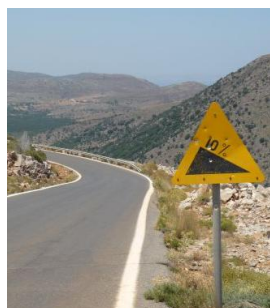
and down hill