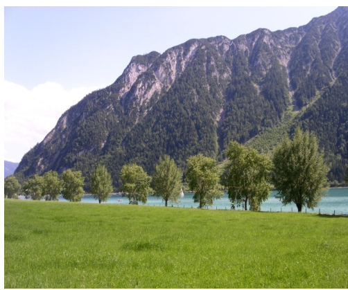
Livlig cykeltrafik på Inn Radweg og flot rute langs sø i Sydtykland.