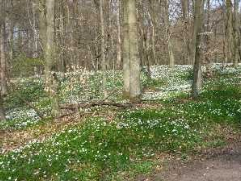
Anemone tid i Nordsjælland - her fra cykelrute 32 nord for Hillerød.