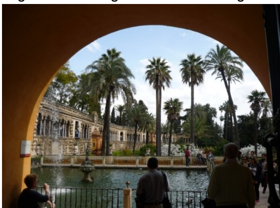
Sevilla: Alcázar og cykelsti langs floden.

På ture i Andalusien har vi før fulgt Via Verde de la Sierra og Via Verde del Aciete. Se turpakke P6, hvortil jeg har hjembragt nye kort. Den sidste aften i Sevilla var vi ude i de smalle labyrint agtige gader bag katedralen og fandt bl.a. den originale flaminco i det gamle kullager - Carbonería.