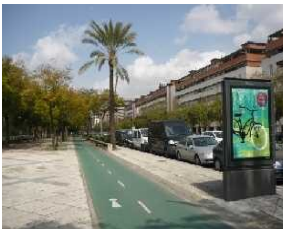
Sevilla. Kamera overvåger at biler kun opholder sig 45 min i centrum. Dobbeltrettet cykelsti under palmer.

Velo-City konferencen var således velfortjent kommet til Sevilla. Vi startede med cocktailparty i haven til Alcázar, som er et lille Alhambre, som jeg en af de efterfølgende dage fik set i dagslys. Ligeledes kan et besøg i den kæmpemæssige katedral anbefales og fra kirketårnet har man godt overblik over landskabet. Men tilbage til konferencen, som bød på mange spændende indlæg.