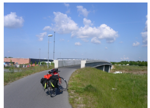
Stibro på N6 over motorvej nær Odense