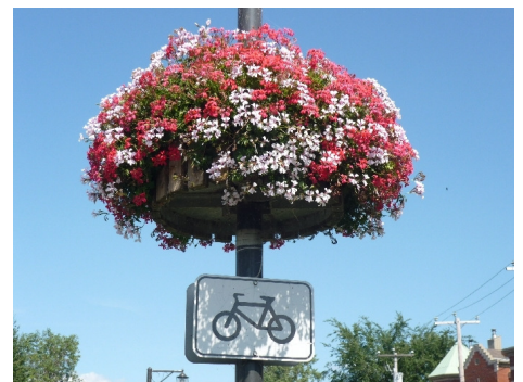
Inspiration fra Canada