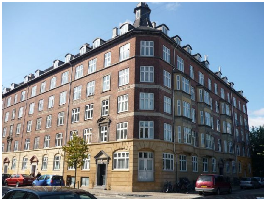
Nordre Fasanvej 199 - det er her vi bor på 1. sal på hjørnet

Det er første gang i Frie Fugles historie, at vi har til huse udenfor Københavns indre by. Tidligere fuglereder var Knabrostræde 20, Nørre Voldgade 21, Ny Adelgade 5A, Pilestræde 8B, Borgergade 6 og Borgergade 14, samt Frederiksberggade 6.