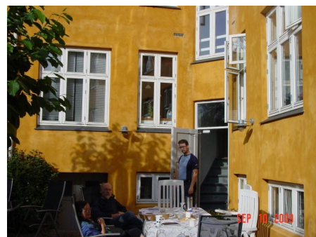
Gårdmøde i vort nye domicil

Vi indkalder hermed til generalforsamling den 28. januar 2010, kl. 17. Dagsordenen ses på vor hjemmeside i god tid inden.