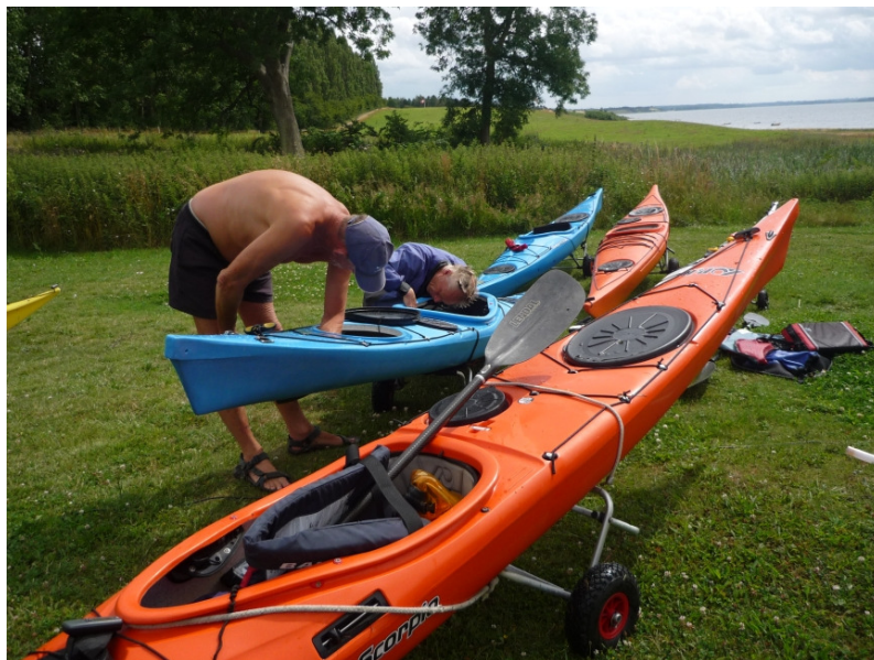
Stemningsbilleder fra kajakkurset ved Hammergården