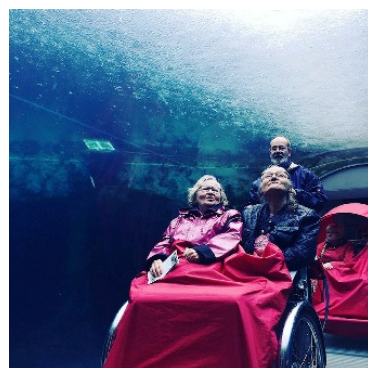
Den Blå Planet