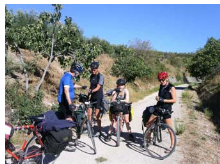
Figenpause på Via Verde de Aciete