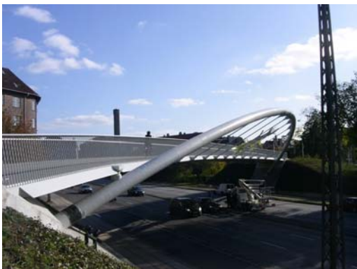
Åbuen og Nørrebroruten

Københavns Kommunen har i år udgivet et nyt cykelkort. Det er som tidligere i skala 1:20.000, men med knapt så mange vejnavne på. Til gengæld er de grønne cykelruter med og flere forslag til cykelmuligheder i parker m.v. Kortet er gratis, kan hentes hos os – og mange andre steder. Jens Erik