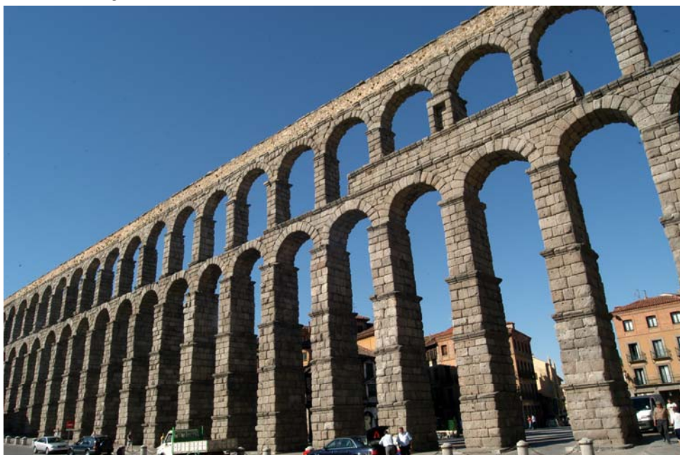
Akvadukt i Segovia