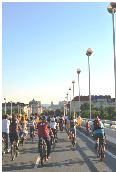
Cykelparade på motorvej i Wien

Fire dage midt i en summende menneskevrimmel af 1400 cykelentusiaster fik derfor humøret til at stige helt op til de høje guldornamente-