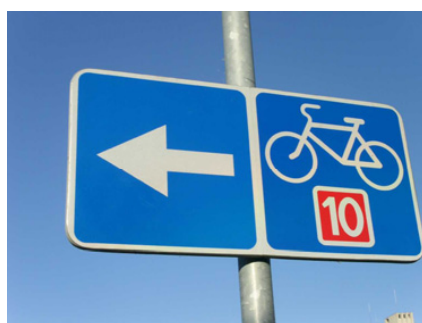
EuroVelo 10 i Lithauen.