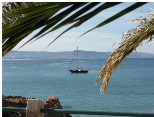
Motiv fra Sardinien

Sardinien er en større ø i Middelhavet, arealmæssigt godt halvdelen af DK. Vi har koncentreret os om nordøen, hvortil der til sommer er gode flyforbindelser fra København til Olbia og fra Billund til Alghero. Eroderede klipper i