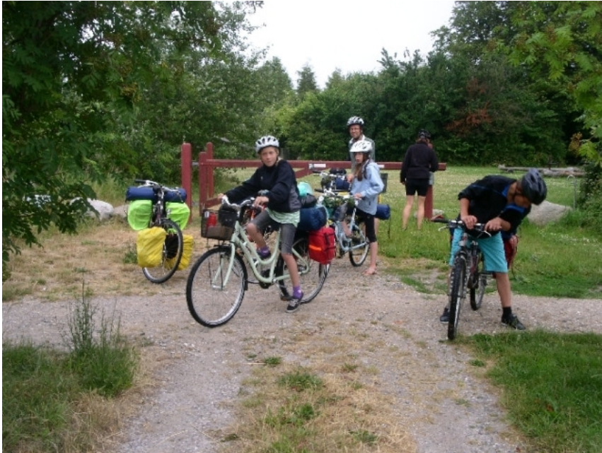
Afgang fra Teltplads Mosehældgård på Møn

Trods den elektroniske tidsalder vi lever i, udkommer ”Overnatning i det fri” endnu en gang i bogform. Der er 995 pladser med i denne nye bog hvoraf 2 er i Sverige, og i henhold til sidste udgave er følgende forbedret: