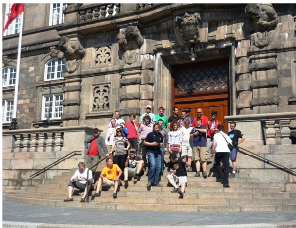
Polakgruppen foran Christiansborg.