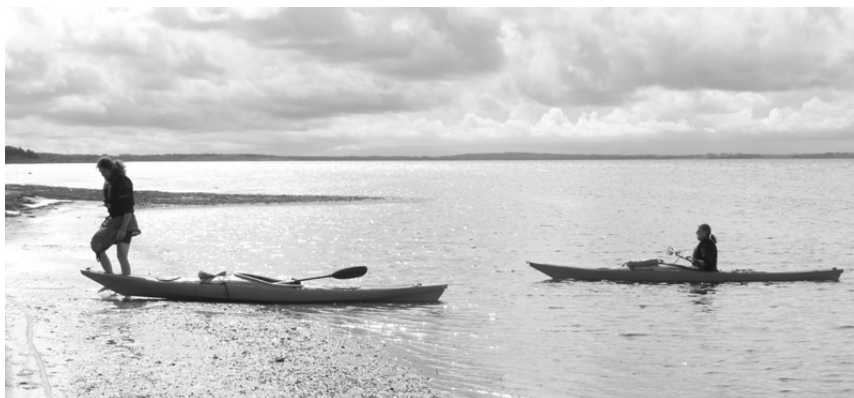
Landgang efter snapsurte samling på Alholmen ved Kulhuse.