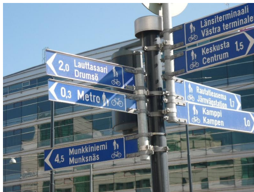
Skiltning af lokale ruter i Helsinki.

Finland har tidligere skiltet et helt net af nationale ruter, men der er for mange rutenumre – i alt 72 nationale ruter – og skiltene er ikke for kønne og opsætningen heller ikke bedste kvalitet.