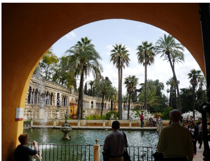
Et kik i haven til Alcázar.