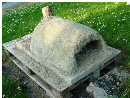
Arnes lerovn version 1.