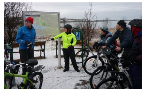
På tur med Islands Cyklistforbund