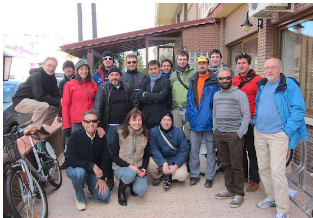
Motiver fra VOCA møde i Nicosia