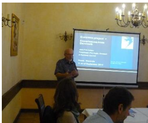
JEL speaking at workshop in Koper.

Det har vi bl.a. gjort ved at medvirke på møder og ekskursioner og ved at holde oplæg på konferencer i Nice (Frankrig), Koper (Slovenien), Limassol (Cypern), Shkodra (Albanien) som omtalt i andre artikler i nyhedsbrevene. Vores engagement i projektet er ikke så stort, vores andel af budgettet er knapt 9000 €. Projektets sidste møde er i Mantova i Italien i maj måned. Det er provinsen Mantova, der er projektet lead partner og projektet løber til september 2015.