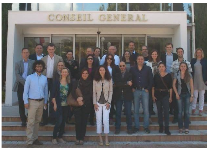
Gruebillede fra første møde i Nice.

Disse organisationer skal udvikle turpakkerne i samarbejde med kommercielle udbydere. Endvidere medvirker ECF (det europæiske cyklistforbund) og Foreningen Frie Fugle. Vores rolle er at medvirke til høj kvalitet af turpakkerne ved at evaluere udkast heraf samt generelt at inspirere til udvikling af EuroVelo 8 ruten.