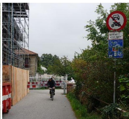
Sti før Carlsberg til bro over: