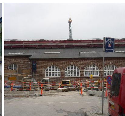
Vejvisning ved Hovedbanegården.