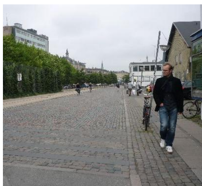
Videre mod Halmtorvet.