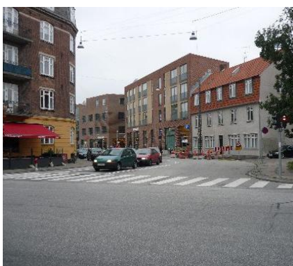
Annex Stræde fra samme sted.