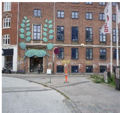
Ved Jernbanevej. Drej th. til