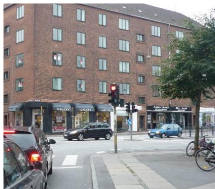
Kryds af Tomsgårds Allé. Valby St. th.