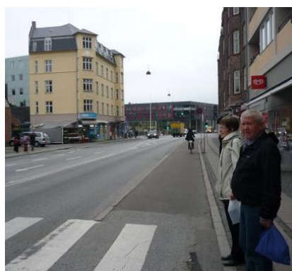
Valby Langgade set mod vest.

Udsnit af Københavns Kommunes Cykelrutekort (1:20.000) mellem Valby Langgade Station og Hovedbanegården. Sti nord for banen på Banevolden forlænges til Enghave Station, hvor der fortsættes på den grønne rute ad Sønder Boulevard. Hele nye forløb indtegnet med lyseblå signatur.