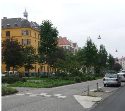
Grønne Sønder Boulevard.