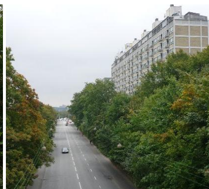
Vigerslev Allé (her går N4 i dag).