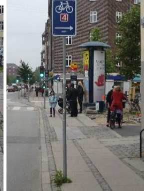
Sønder Boulevard ved Vester Fælledvej. Ved Enghave Station. Vejvisning fra Enghavevej til Sønder Boulevard.